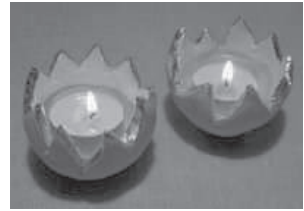
Windlicht aus Ton