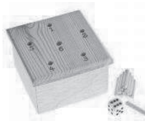
"Das andere Würfelspiel"