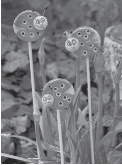
Blumenstecker aus Ton