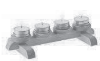
Kerzenständer für Teelicht