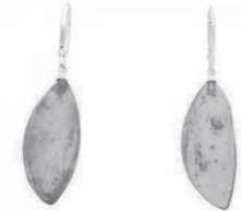
Ohrschmuck aus Bernstein