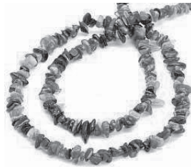
Kette aus Halbedelsteinen