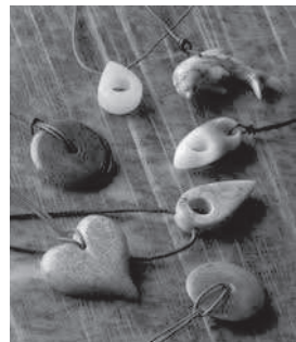
Anhänger aus Speckstein