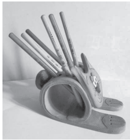
Stifthalter aus Ton